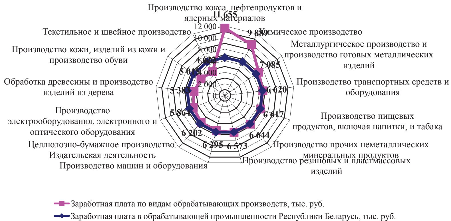
Рис. 1 Среднемесячная номинальная заработная плата в обрабатывающей промышленности Республики Беларусь в 2014 г.