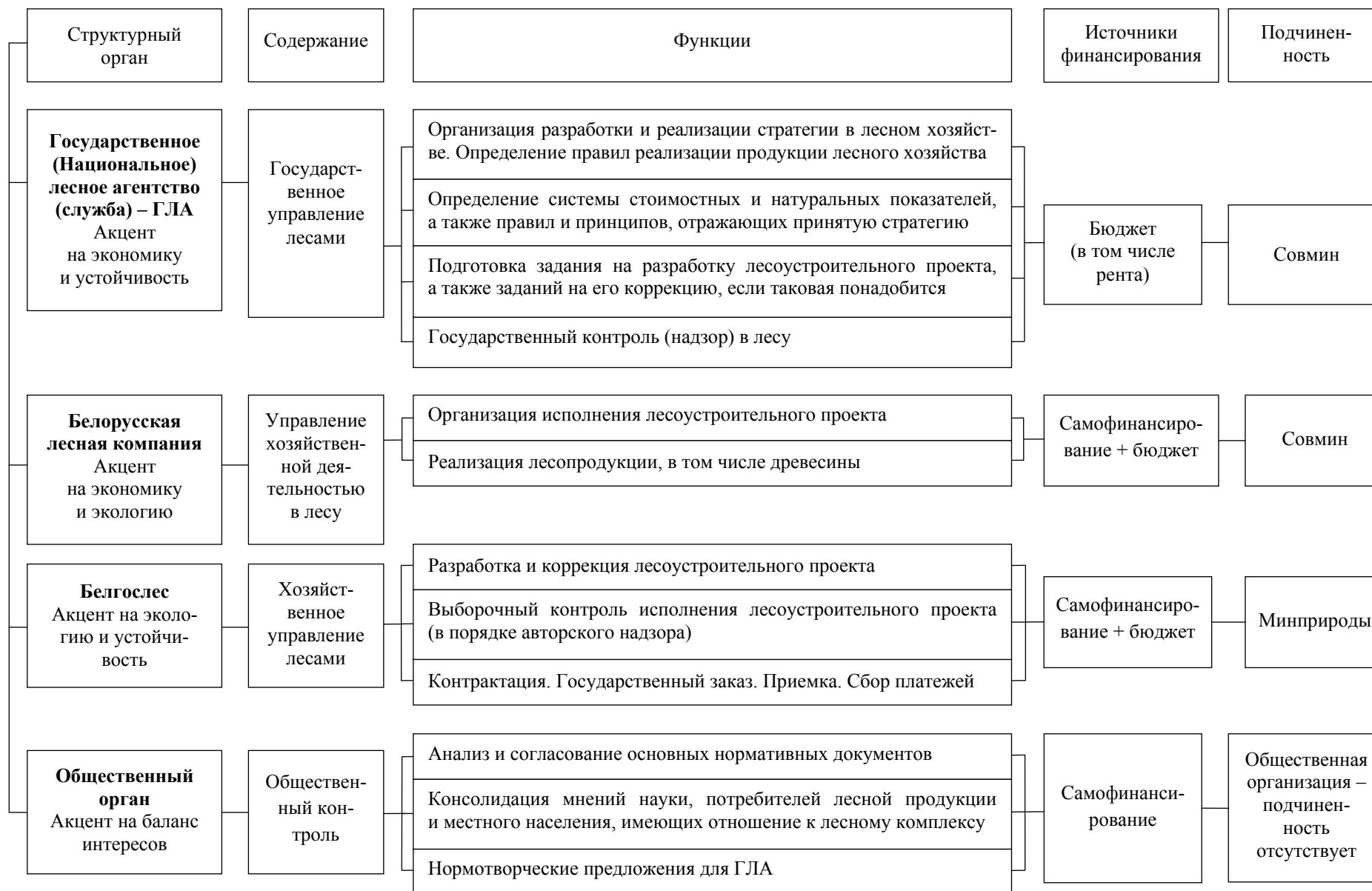
Рис. 3. Предлагаемая организационная структура управления лесным хозяйством (третья модель)