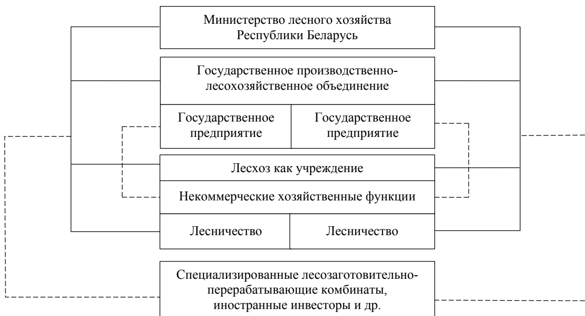
Рис. 2. Предлагаемая организационная модель управления лесным хозяйством (вторая модель)

1. Государственное (национальное) лесное агентство. Основная функция – государственный контроль и государственное управление лесами. Акцент – на экологию и экономику.