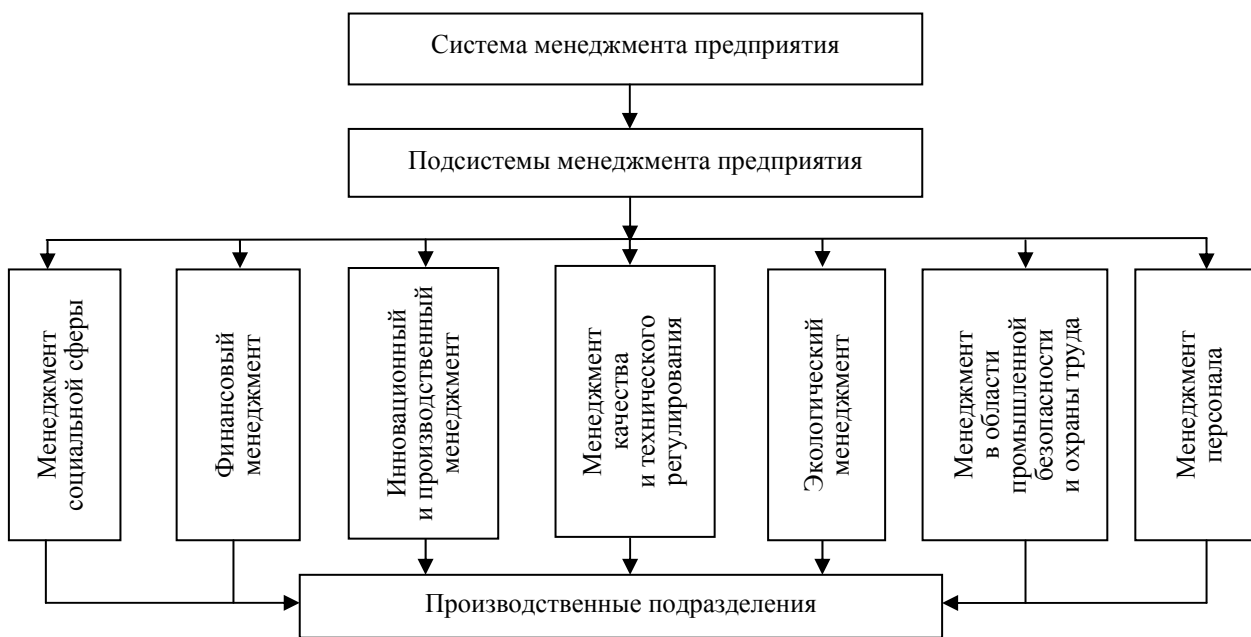
Рис. 1. Система управления предприятием

Это означает, что гарантированный уровень экологической безопасности производства и продукции может быть достигнут при комплексном подходе по ее формированию на всех этапах производства и реализации продукции, включая маркетинг и изучение рынка, проектирование и разработку товара, материально-техническое обеспечение, технологическую подготовку производства, собственное производство, контроль и проведение испытаний, упаковку и хранение, реализацию продукции [1].