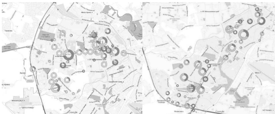
Рисунок 2 – Схема размещения цветников на территории Московского (слева) и Фрунзенского (справа) районов г. Минска

Выявлено, что основной проблемой цветочного оформления Московского и Фрунзенского районов г. Минска является ограниченный ассортимент цветочных культур, часто несоответствие элементов цветочно-декоративного оформления стилистике и колористике окружающей пространства. С целью решения выявленных проблем актуальным является разработка комплексного подхода к формированию элементов цветочного оформления административных районов и г. Минска в целом, а также широкое использование многолетних цветочных культур разнообразного облика и сроков цветения.