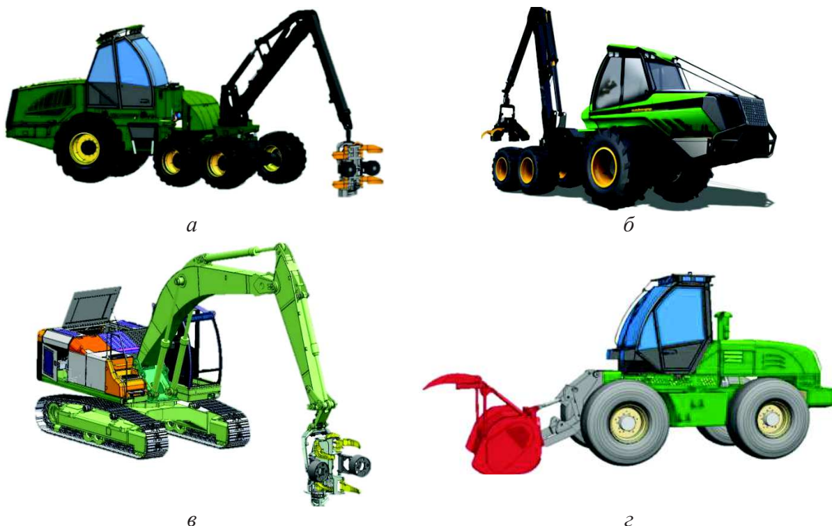
а – Амкодор-2561; б – Амкодор-2571; в – Амкодор-925; г – мульчер «Амкодор» Рисунок 2 – Перспективные лесные машины ОАО «Амкодор»

Важным направлением развития завода также является постоянное повышение качества выпускаемых машин. Ежедневно конструктора холдинга разрабатывают новые решения для повышения надежности машин, повышения производительности и топливной экономичности, обеспечения комфорта оператора и др. Так, с целью повышения экономичности харвестеров и оптимизации режимов работы их гидросистем в харвестере Амкодор-2561 внедрена новая система регулирования работы гидравлического насоса, в харвестере Амкодор-2571 нашла отражение перспективная система раздельного гидравлического привода харвестерной головки, манипулятора и движителя от двух регулируемых гидравлических насосов разной номинальной производительности. В целом, на конструкции и системы используемые в лесных машинах Амкодор сотрудниками предприятия получено более 40 патентов.