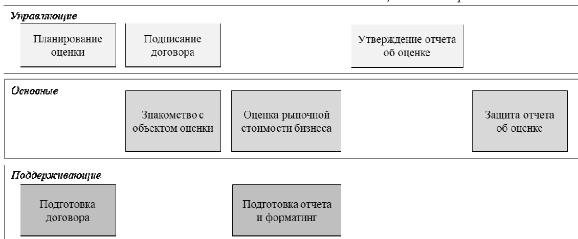
Рисунок 1 – Модель бизнес-процессов оценки бизнеса

В Беларуси для оценки рыночной стоимости бизнеса используется доходный подход. Основным звеном модели, несущим ценность для потребителя, является оценка рыночной стоимости бизнеса, поэтому необходимо детализировать данный бизнес-процесс на подпроцессы (рисунок 2).