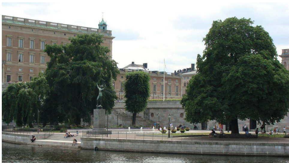
Рисунок 1 – Сквер Стрёмпартеррен, Стокгольм, Швеция

Линейные объекты сквера, в частности дорожно-тропиночная сеть, устраиваются, как правило, в регулярном стиле, тогда как посадки больше подчиняются пейзажному или смешанному стилю. Отсутствует строгая формовка крон древесных растений, ей подвергаются только газон и некоторые кустарники. Дорожное покрытие чаще всего выполняется мощением из светлых материалов (рис. 1).