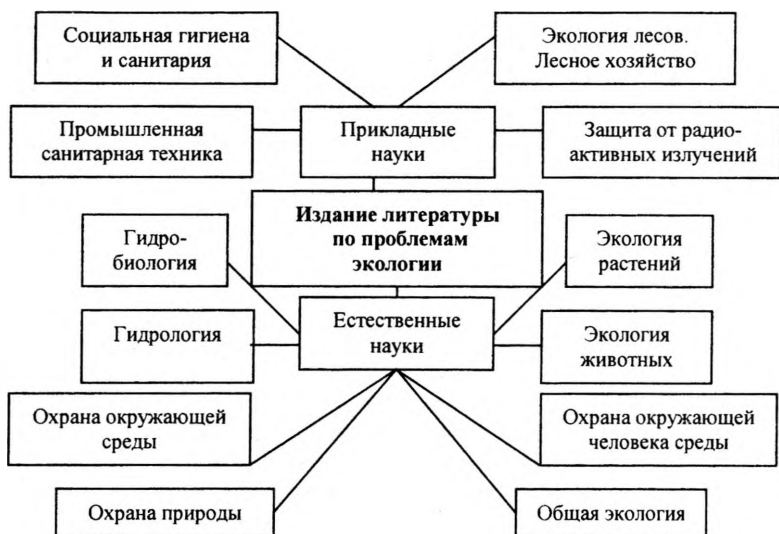
Рис. 4. Тематика литературы по проблемам экологии в 1990 г.

Книговедческий анализ позволил создать картину тематических направлений издаваемой литературы по экологической проблематике в период 1971—1990 гг. (рис. 4).