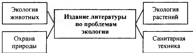
Рис. 1. Тематика литературы по экологической проблематике в начале XX в.

В начале XX столетия экология продолжает развиваться как комплексная наука, одновременно дифференцируя составляющие ее знания. Экологические вопросы теперь рассматриваются глубже, они все больше приобретают прикладной характер. Тематическая картина книг экологического содержания приобретает вид, представленный на рис. 1.