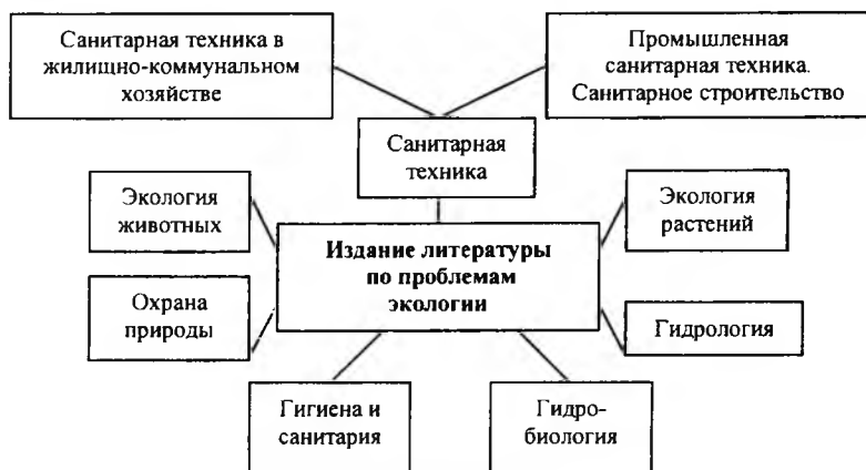
Рис. 3. Тематика литературы по проблемам экологии к 1970 г.

Несмотря на неудачи во внедрении экологических принципов в хозяйственную деятельность, круг наук, вовлеченных в экологическую проблематику, продолжал расширяться. Экология, которая долгое время была объектом изучения естественных наук, к концу 70-х гг. все больше попадает в поле зрения наук технических и отчасти гуманитарных. Благодаря этому тематический спектр литературы по проблемам экологии значительно расширился (рис. 3).