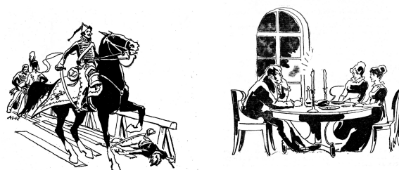
Рис. 2. Иллюстрации к роману «Война и мир», условно названные «Всадник» и «Светский вечер»

При сравнении различных вариантов сочетаний текста, набранного десятью шрифтами, с шестью разными иллюстрациями каждый эксперт (как и в первой серии) заполнял матрицу парных сравнений. Всего были получены 108 таблиц, заполненных экспертами. После обработки данных всех таблиц для каждой иллюстрации и гарнитуры была получена суммарная частота предпочтений и определен ранг. Для полноты эксперимента по методу парных сравнений также была определена удобочитаемость шрифтов. Ранговые характеристики второй серии эксперимента представлены в табл. 2.