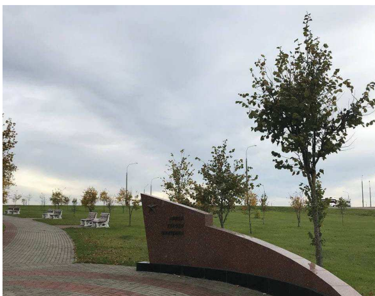
Рисунок 3 – Состояние липы мелколистной в посадках Аллеи Героев Минщины

Наихудшее состояние отмечено у липы мелколистной, произрастающей в Аллее Героев Минщины – 97,5% деревьев имеют плохое состояние: крона изреженная, листва мельче обычной и преждевременно опадает, значительна доля усохших ветвей (рисунок 3). Вероятной причиной ослабления растений является близость автомобильной трассы с высокой интенсивностью движения. Это подтверждается тем, что степень усыхания деревьев сокращается по мере удаления их от дорожного полотна.