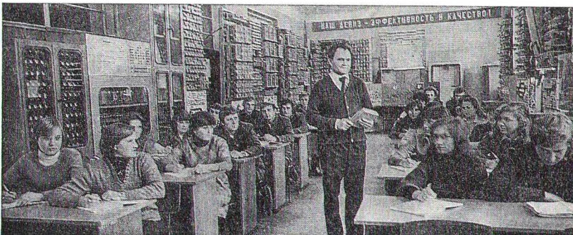
Занятия учащихся Брестского техникума железнодорожного транспорта в лаборатории автоматизации и телемеханики.

В годы Вел. Отечеств. войны нем.-фац. оккупанты разрушили и разграбили почти всю материальную базу средних спец. уч. заведений. После освобождения в республике развернулись работы по восстановлению и развитию средних спец. уч. заведений. В 1943 в освобождённом Гомеле начал работу Минский политехникум, в 1944 восстановлена большая ч. довоен. техникумов и училищ. В 1945/46 уч. г. в БССР работали 94 средних спец. уч. заведения (26,2 тыс. уч-ся). В послевоен. перипод открыты новые уч. заведения: Пинский мясной и молочной пром-сти, Жировичский и Пинский сельскохозяйств.