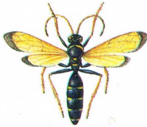
Да арт. Дарожныя васы. Пампіл дарожны.

Шматгадовыя травяністыя расліны з карэнішчам і прамастойнымі простымі або слабагалінастымі сцябламі. Прыкаранёвае лісце яйцападобна-круглаватае, з доўгімі чаранкамі, сцябловае — яйцападобна-эліпсоіднае. Кветкавыя кошыкі дыям. 6—8 см, жоўтыя, адзіночныя або ў шчытканадобных суквеццях. Цвітуць у маі—чэрвені. Плод — сямянка. Докар. і лек. расліны, выкарыстоўваюцца для групавых пасадак, на газонах і камяністых горках. Размнажаюць дзяленнем карэнішчаў. Г.У.Вянаеў.