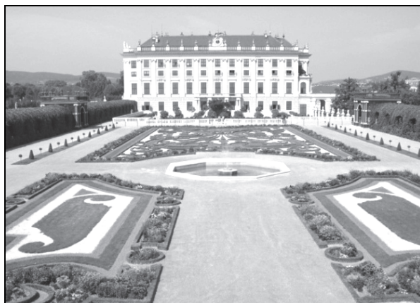
Рис. 3. Цветочные партеры Сада Кронпринца

В 1752 г. в конце западной диагональной оси на месте зверинца создается зоопарк, ставший первым зоологическим парком в Европе. В центре зоопарка был построен восьмиугольный павильон (архитектор Н. Жано де Вилле Иссей), окруженный тридцатью секциями. Центр