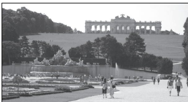
Рис. 4. Вид на Большой партер, фонтан Нептуна и Глориетту

В 1775 г. на Шенбрунском холме воздвигается Глориетта – смотровой павильон для императрицы. Склон холма оформляется террасами с лестничными спусками, двенадцатью водоемами с фонтанами и многочисленными скульптурами. Из-за недостатка воды для питания вскоре водоемы были засыпаны, и вся вода пошла на оснащение главного фонтана Нептуна у подножья холма. В это же время звездообразный водоем с партера был перемещен в центр западной звезды аллеи (рис. 4).