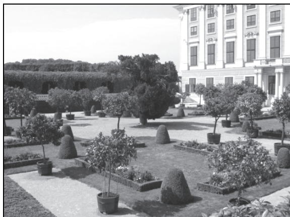
Рис. 2. Фрагмент Приватного сада с тиссом и цитрусовыми растениями в кадках

Третий этап строительства парка приходится на 1772–1780 гг. и связан с перепланировкой парка, согласно тенденциям английского пейзажного стиля (архитектор Ж. Ф. Хетцендорф фон Хохенберг). В это время в парке были возведены романтические сооружения – Римские Руины (1778 г., художники Б. Хенречи, В. Бауэр, Ф. Цахерле), фонтан Обелиск (1778 г., художники Б. Хенречи, В. Бауэр), немного позже – фонтан Нептуна (1780 г., художник В. Бауэр).