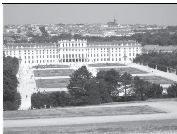
Рис. 5. Панорама со стороны Шенбрунского холма на дворец, Большой партер и Вену

Центральное место в парке занимает Большой партер. В середине XVIII в. он приобретает тот вид газонно-орнаментального партера, который дошел до нашего времени (рис. 5). Партер был заполнен характерными для барокко арабесками, выполненными из цветов и гальки, земли и низко подстриженного самшита. Его композиционное решение постоянно менялось. Судя по картине Бернардо Коналетто (1721–1780 гг.) «Перспектива Дворца Шенбрунна» (1760 г.), партер состоял из шести газонно-орнаментальных частей, по периметру обсаженных цветочными рабатками. В двух южных частях были устроены буленгрины. По главной оси партера располагалась променада с водоемом и фонтаном, полосами газона с топиарными формами и растениями в кадках.