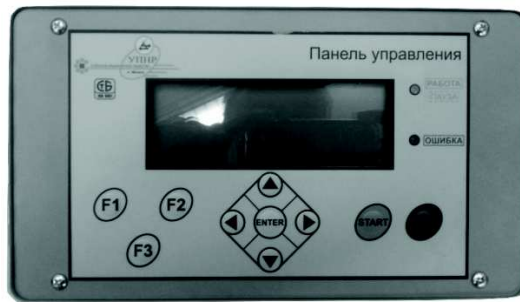
Рисунок 1 – Цифровая панель управления

Рассмотрим принцип работы выпрямителя на блок-схеме, представленной на рисунке 2.