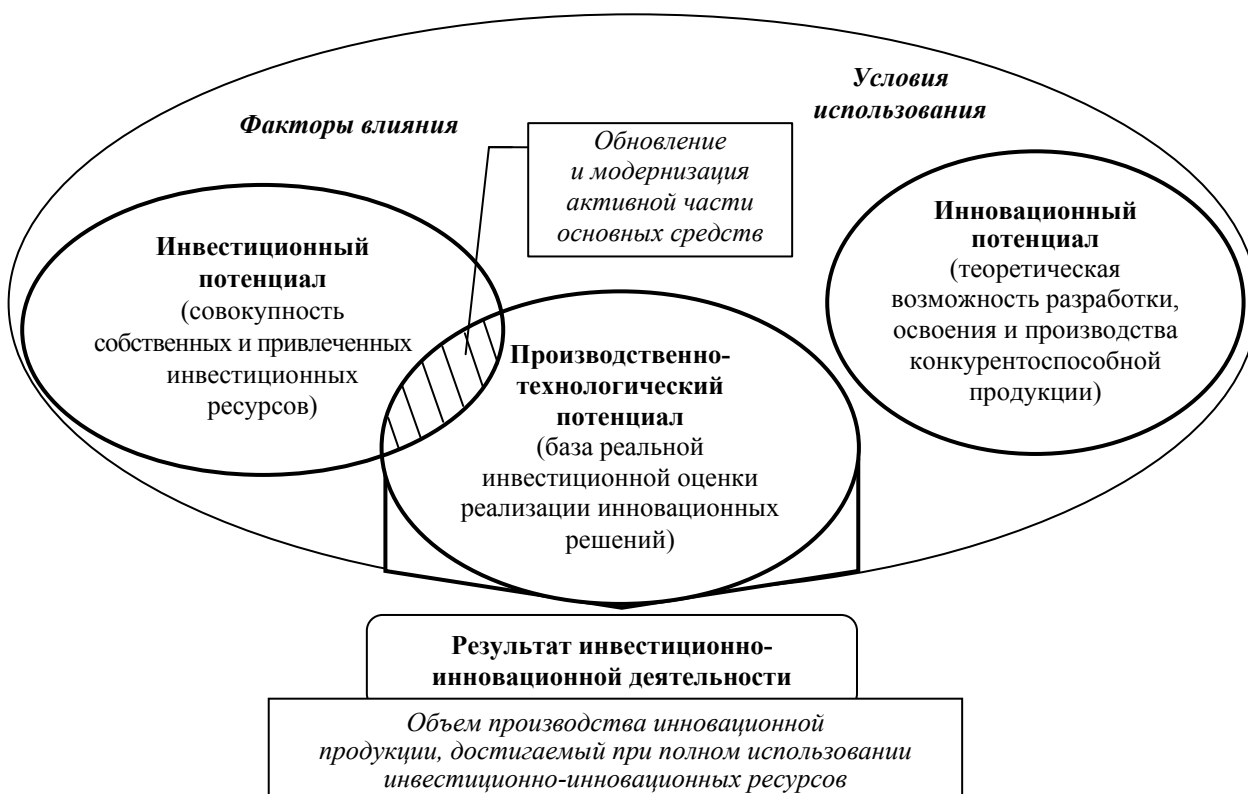
Рис. 1. Взаимосвязь потенциалов в концепции формирования инвестиционно-инновационного потенциала экономической системы

Если применительно к инвестиционному потенциалу большинство исследователей сходятся во мнении, что основу его структуры составляют собственные и привлеченные источники предприятия, то при рассмотрении инновационного потенциала суждения относительно его структуры существенно отличаются и, как следствие, отсутствует единый подход к составу его основных элементов.