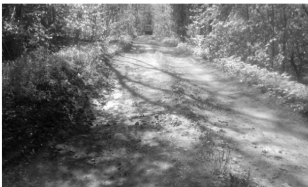
Рис. 1. Первоначальное состояние участка дороги

полотна – супесь легкая. На данном участке были устроены два участка № 1 и № 2, протяженность которых 50 м каждого. Участок № 1 построен с использованием покрытия из цементогрунта, № 2 – конструкции из армированного каркаса «георешетка-цементогрунт», № 3 – контрольный.