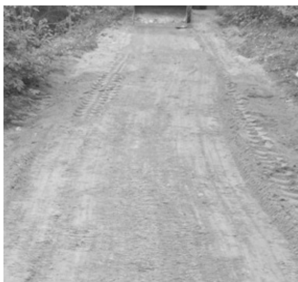
Рис. 3. Готовый участок лесной автомобильной дороги в ГЛХУ «Лидский лесхоз»

На рис. 3 представлен окончательный вид участка лесной автомобильной дороги с использованием в конструкции армированного каркаса «георешетка-цементогрунт».