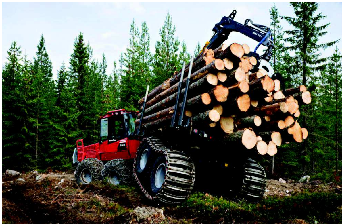
Рисунок 1 – Харвестер Komatsu 931.1 и форвардер Komatsu 890.3