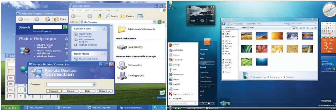
Рисунок 3 - Windows XP и Windows 7

Но как мы уже помним, Microsoft любит удивлять, и уже в 2013 выходит абсолютно новая операционная система Windows 8.1. Microsoft отошли от предыдущего дизайна и начали все буквально с нуля. Metro – так именовался новый стиль в котором было выполнено абсолютно все оформление в Windows 8.1(Рис. 4). Связано это решение было с тем, что на рынке набирали очень большую популярность планшетные аппараты. По цене они были в разы дешевле ноутбуков, но в роли операционной системы была полноценная Windows. И больше нас удивлять Windows не собиралось, так как Windows 10 отошла далеко от Windows 8.1. И по последним новостям Windows 10 станет последним продуктом этой «линейки».