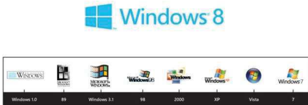
Рисунок 1 - Изменение дизайна логотипа

Свое исследование я начал еще с момента зарождения компании Microsoft, с его самого первого «детища» – Windows 1.0(1985). Безусловно эта операционная система была прорывом среди всех конкурентов на рынке, это была первая оконная общедоступная операционная система. Но о дизайне говорить еще рано, так как на ближайшие 10 лет он был полностью ограничен функциональной частью, простые квадратные окна, очень скудная цветовая гамма, все чем были «богаты» операционные системы выходявшие на протяжении этого десятилетия, комплектующие того времени просто не могли обработать какую-то графическую информацию, помимо отрисовки окон, единственное о чем можно судить со стороны дизайна, это логотипе, так как на протяжении десятилетий он претерпел огромные изменения (рис. 1).