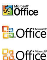
Рисунок 6 - Логотипы Office(2003, 2007, 2009)

Логотип изменялся таким же образом, отчего-то красочного, до минимализма (рис. 6).