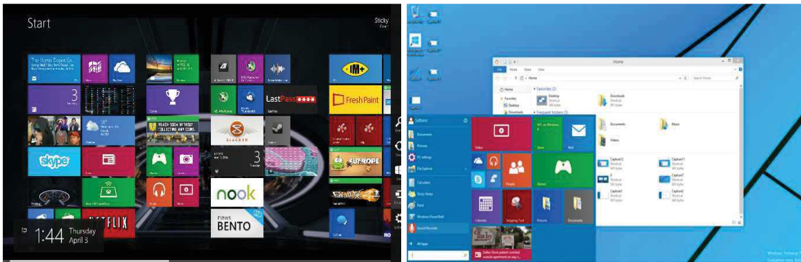
Рисунок 4 - Windows 8 и Windows 10

Но как мы уже помним, Microsoft любит удивлять, и уже в 2013 выходит абсолютно новая операционная система Windows 8.1. Microsoft отошли от предыдущего дизайна и начали все буквально с нуля. Metro – так именовался новый стиль в котором было выполнено абсолютно все оформление в Windows 8.1(Рис. 4). Связано это решение было с тем, что на рынке набирали очень большую популярность планшетные аппараты. По цене они были в разы дешевле ноутбуков, но в роли операционной системы была полноценная Windows. И больше нас удивлять Windows не собиралось, так как Windows 10 отошла далеко от Windows 8.1. И по последним новостям Windows 10 станет последним продуктом этой «линейки».