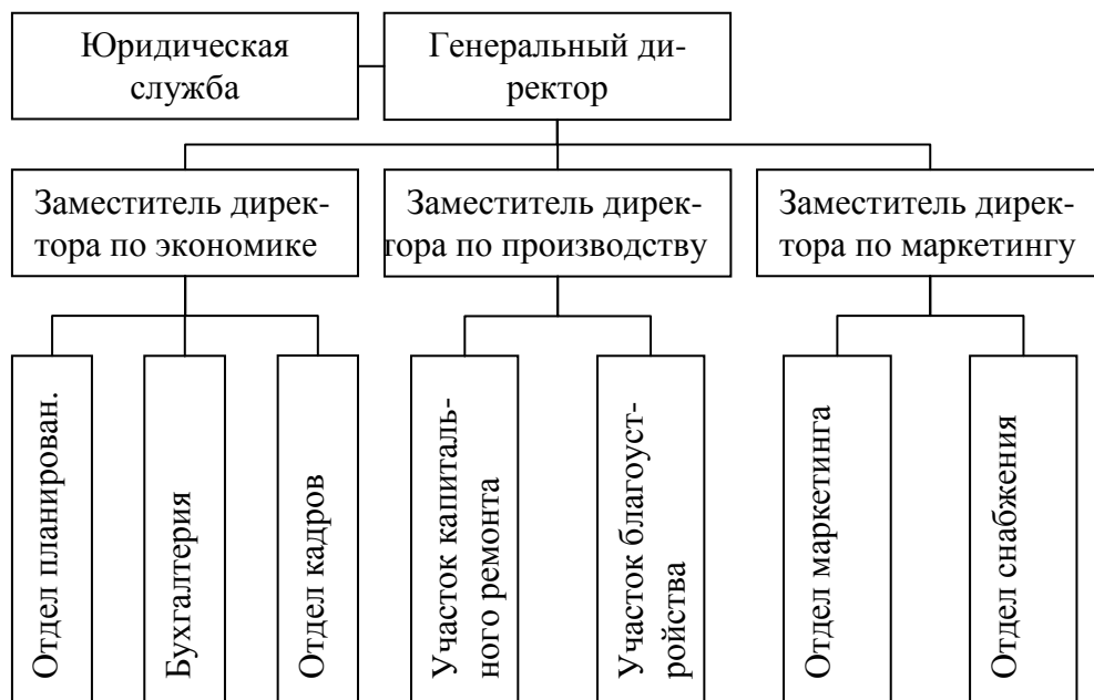
Рис. 3. Схема линейно-функциональной организационной структуры

В матричной схеме организационной структуры управления наряду с линейными руководителями и функциональным аппаратом управления выделяются предметно-специализированные звенья, во главе которых стоят руководители проектов или определенных программ (рис. 4). Руководитель проекта выступает как линейный руководитель для специалистов, выделенных в самостоятельные подразделения и занятых планированием и координацией работ по проекту или программе. Одновременно он является и функциональным руководителем. При этом управляющее воздействие направлено на выполнение целевой программы, в решении которой участвуют все подразделения организации. В данном случае осуществляется введение временных органов и подразделений, которые координируют существующие горизонтальные связи по выполнению конкретного проекта. После завершения выполнения проекта, такие органы и подразделения могут быть расформированы.