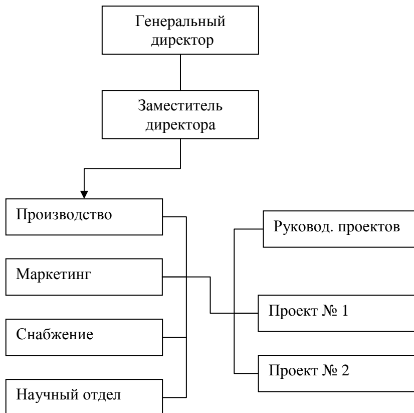
Рис. 4. Схема матричной структуры управления

На практике организационная структура управления предприятиями садово-паркового строительства и хозяйства может иметь значительные отклонения от приведенных схем. В составе предприятий могут быть подразделения, связанные с хранением производственных запасов, с ремонтом машин и механизмов, отделы защиты зеленых насаждений от вредителей и болезней, проектирования и строительства и т. п.