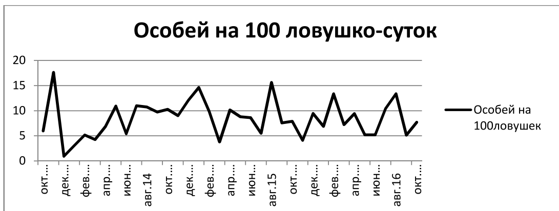
Рисунок 1. Динамика численности (количество особей) волка на фотоловушках в пересчете на 100 ловушко/суток

Данные мониторинга волка на фотоловушках и выводы об отсутствии роста численности волка подтверждаются данными по добыче этого вида в Национальном парке «Беловежская пуца».