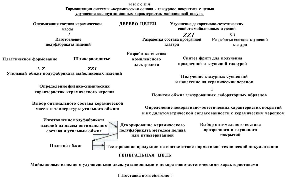
Рис. 1. Дендрограмма кластеризации