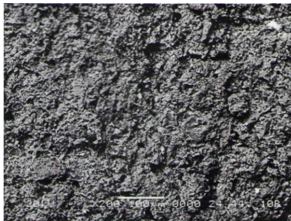
Рис. 2. Электронно-микроскопическое изображение поверхности скола керамической основы оптимального состава после обжига при температуре 1080±5 °С с выдержкой 1,5 ч

Полученные результаты позволили сделать вывод, что жидкая фаза играет важную роль в процессе формирования структуры майоликовых изделий с улучшенными эксплуатационными характеристиками. Однако повышенное количество расплава при температуре 1100 °С может привести к снижению устойчивости изделий при обжиге, поэтому выбор оптимальных температурно-временных параметров обжига является ответственным фактором в общем подходе к решению технологических задач.