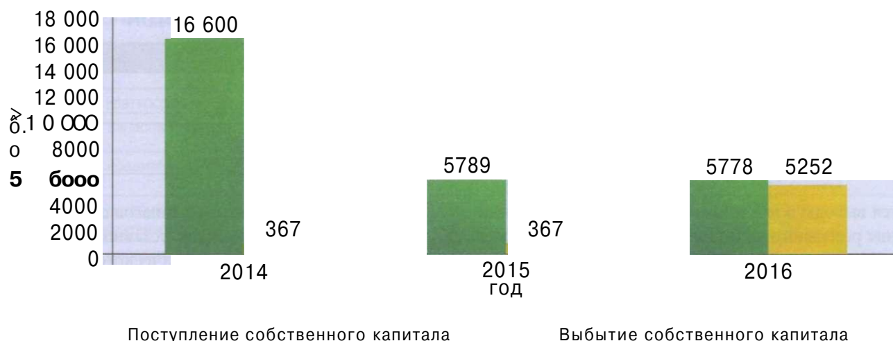
Рис. 3. Динамика движения собственного капитала в ОАО «Керан»

дена, что позволило увеличить собственный капитал на 5455 тыс. руб. Также в 2016 году значительно увеличилась сумма выбытия собственного капитала по сравнению с 2015 годом, которая составила 5252 тыс. руб., что связано с получением в организации непокрытого убытка в сумме 4961 тыс. руб. Изменение собственного капитала за 2014-2016 годы представлено на рисунке 3.