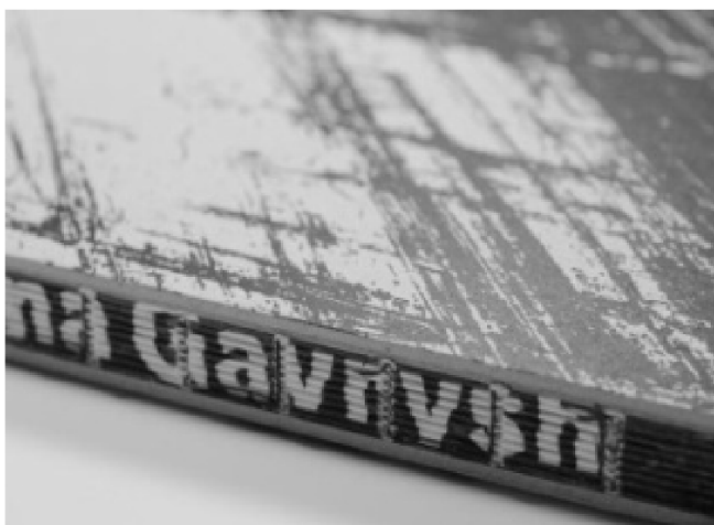
Рис. 1. Книжковий дизайн з відкритою фактурою корінця книжкового блоку.