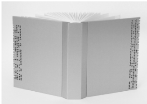
Рис. 2. Дизайнерська конструкція книги з вільним корінцем і боковинами з лазерною перфорацією.