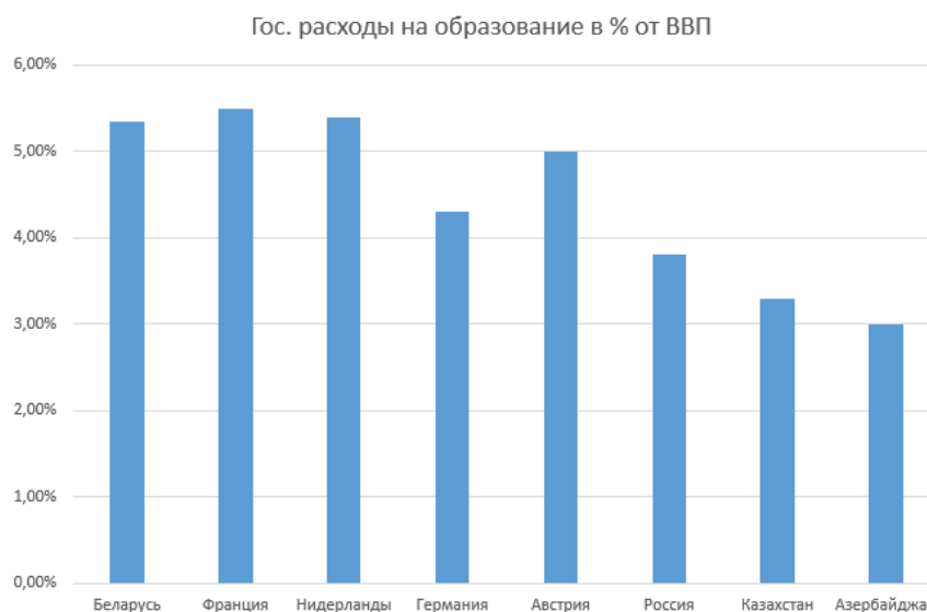
Рисунок 3 – Влияние образования на экономику стран в мире в 2014–2016 гг.

На рис. 3 можно наблюдать как объемы финансирования сферы образования Республики Беларусь соизмеримы с государственными расходами на образование в большинстве развитых стран мира и превышают расходы России и Казахстана.