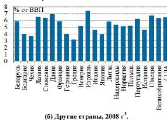
Рисунок 2 – государственные расходы на образование в 2008 году

На рис. 2 представлены государственные расходы на образование в различных странах в 2008 г. в % от ВВП.