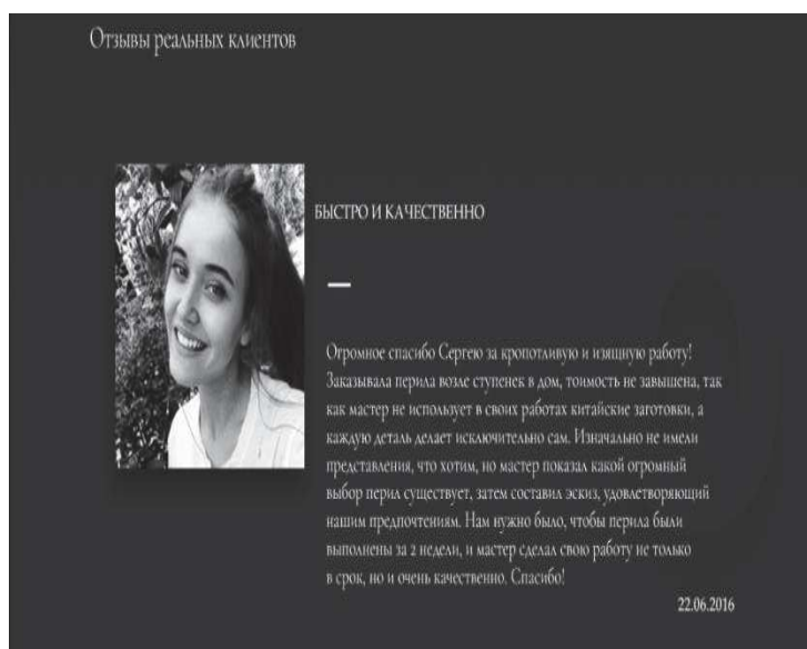
Рисунок 4 - Красивые фото

Психология форм. Люди ассоциируют различные формы с чувствами, эмоциями и настроениями. На эту тему было проведено много исследований. И было выявлено, что круги, овалы, эллипсы – вызывают позитивные эмоции, связанные с сообществом, дружбой, связями, отношениями, единством, женственностью. В то время как прямоугольники и треугольники означают стабильность, баланс, силу, профессионализм, эффективность, мужественность.