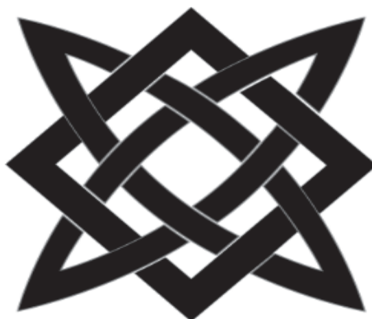
Рисунок 5 - Логотип кузнечной мастерской

В качестве логотипа для кузнечной мастерской был выбран символ Бога- кузнеца. Четкие линии квадрата, символизирующие стабильность, мужественность гармонично переплетаются с более мягкими немного овальной формы дугами, что добавляет нотки доверия и дружелюбности в логотип (рисунок 5).