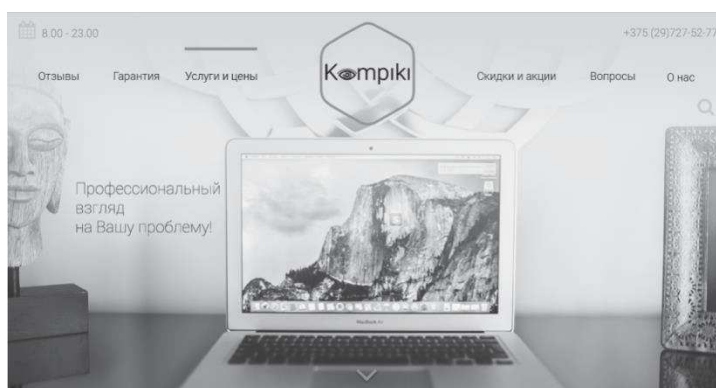
Рисунок 1 - Макет сайта «Kompiki.by»

Обратите внимание на изображение главной страницы, какое послание она несет? Указано ли на странице, что это ремонт компьютеров? Написаны ли преимущества компании? На посадочной странице нет главного рекламного текста для своих потребителей.