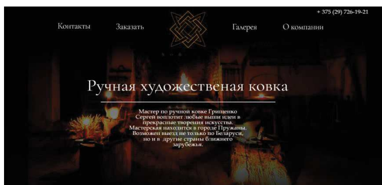
Рисунок 2 - Страница сайта кузнечной мастерской

Зачастую при проектировании дизайна сайта необходимо привлечь внимание пользователя к конкретной точке, это может быть слоган либо конкретное изображение. Для этого проектировщик использует другой шрифт, цвет или размер элемента. Эффект человеческой памяти, при котором объект, выделяющийся из ряда однородных, запоминается лучше других называется эффектом Ресторфф или эффектом изоляции. На рисунке 2 представлена главная страница сайта кузнечной мастерской. Внимание пользователя привлекается к тексту: «Ручная художественная ковка». Это достигается выбором гарнитуры шрифта, его размера, а также размещением текста по центру).