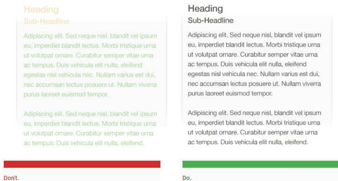
Рисунок 2 – Пример контрастности