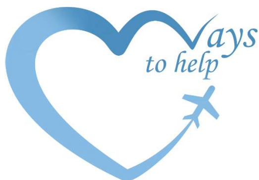
Рисунок 1 – Логотип «Ways to help»

Есть еще одна возможность переводить мили, но не конкретно на ребенка, а на организацию. Суть состоит в следующем. Например, белорусская авиакомпания «Белавиа» предлагает своим пассажирам программу под названием «Лидер», а российская авиакомпания «Аэрофлот» – «Бонус», которые дают возможность своим пассажирам-участникам накапливать баллы на персональном счете за регулярные полеты, которые потом можно обменивать на билеты. Так вот, в этом приложении можно осуществлять социальное партнерство благотворительных фондов с авиаперевозчиками, которое позволит пассажирам данной авиакомпании перечислять накопленные мили на счет организации.