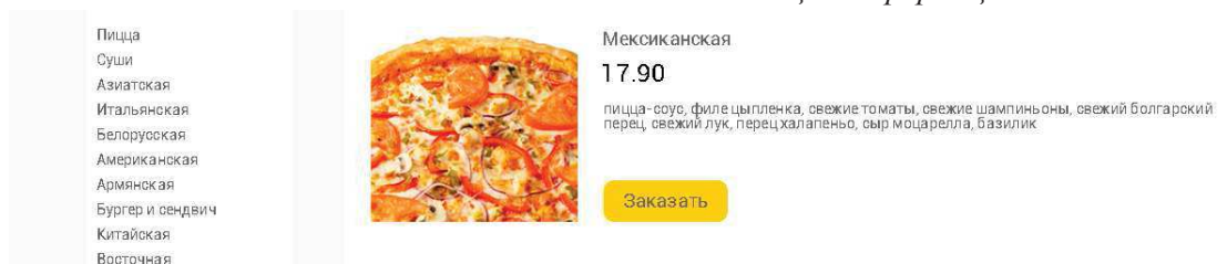
Рисунок 4 – Информация о доставке

Интернет магазины доставки еды не относятся к сложным по функционалу. Основные функции: возможность добавить товар в корзину находясь в каталоге, без перехода в карточку товара, удобная сортировка по цене или названию, корзина с возможностью оформить заказ в один клик или заполнить всю информацию о доставке, поиск по названию блюда или по названию заведения.