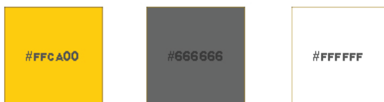
Рисунок 1 – Главные цвета сайта

Основными цветами сайта были выбраны желтый, серый и белый, представлены на рисунке 1.