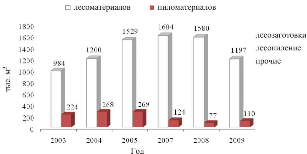
Рис. 4. Динамика экспорта продукции лесопромышленного производства лесхозов