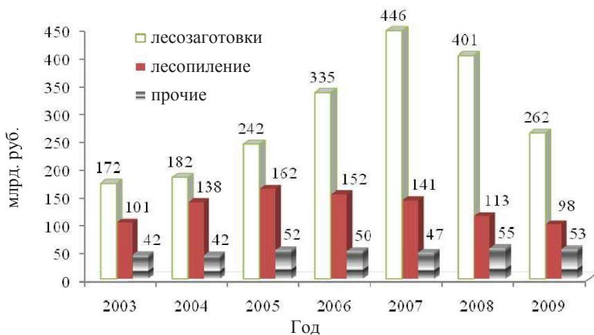
Рис. 3. Динамика реализации продукции лесопромышленного производства лесхозов в сопоставимых ценах 2009 г.

риод. Так, за 2005–2009 гг. доля лесопиления в общем объеме реализованной лесхозами продукции уменьшилась с 36% до 24%. По нашему мнению, она и далее будет падать под влиянием конкуренции со стороны частного бизнеса.