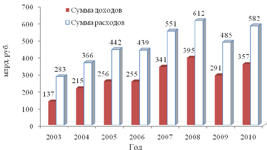
Рис. 1. Динамика доходов и расходов по лесохозяйственному производству учреждений Министерства лесного хозяйства Республики Беларусь в сопоставимых ценах 2010 г.