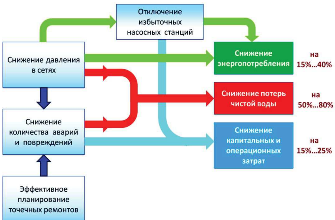
Рисунок 2. Направления снижения издержек водоканалов с помощью инструментов CityCom.