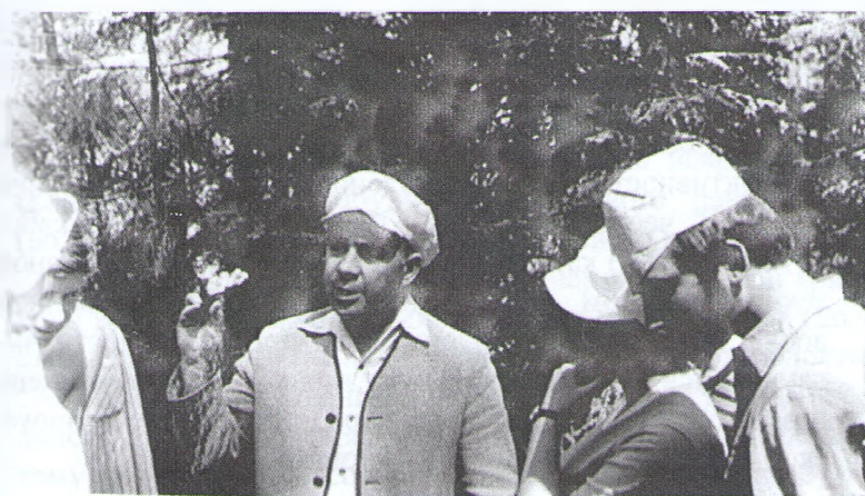
Со студентами на практике по лесозащите в Негорельском учебно-опытном лесхозе (1990 г.)