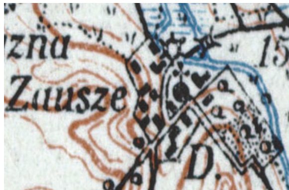
Рис. 4. План усадьбы Заушье на карте Речи Посполитой 1936 г.

вероятно, относился к парку, а другой, с более плотным наполнением, расположенный ближе к острову на р. Уша, – к фруктовому саду. Парк с садом, как и ранее, располагался вдоль р. Уша, но, судя по плану фольварка, площадь его несколько сократилась. Хотя это может быть только неточность, появившаяся при составлении карты.