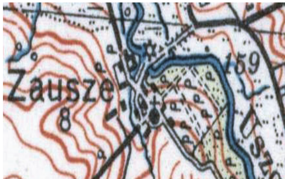
Рис. 3. План усадьбы Заушье на карте Речи Посполитой 1924 г.

Главная аллея шла от дворца в сторону р. Уша, а от этой аллеи в юго-западном направлении отходили две параллельные аллеи. В общем, эти две аллеи шли параллельно течению р. Уша. Судя по колористической гамме карты, сам парк располагался вдоль реки, а ближе к дворцу располагался фруктовый сад, вероятно, еще с остатками английского огорода (рис. 3).