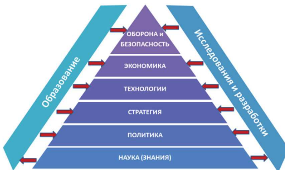
Рис 1. Фундаментальная наука как базовый институт развития

время ни одно государство в Мире не способно обеспечить самостоятельно весь спектр фундаментальных научных исследований. В связи с этим дальнейшее развитие фундаментальных научных исследований по прорывным направлениям будет зависеть от уровня научной кооперации многих стран. При этом можно ожидать создание международных центров научного превосходства, вход в которые может быть открыт не для всех претендентов.