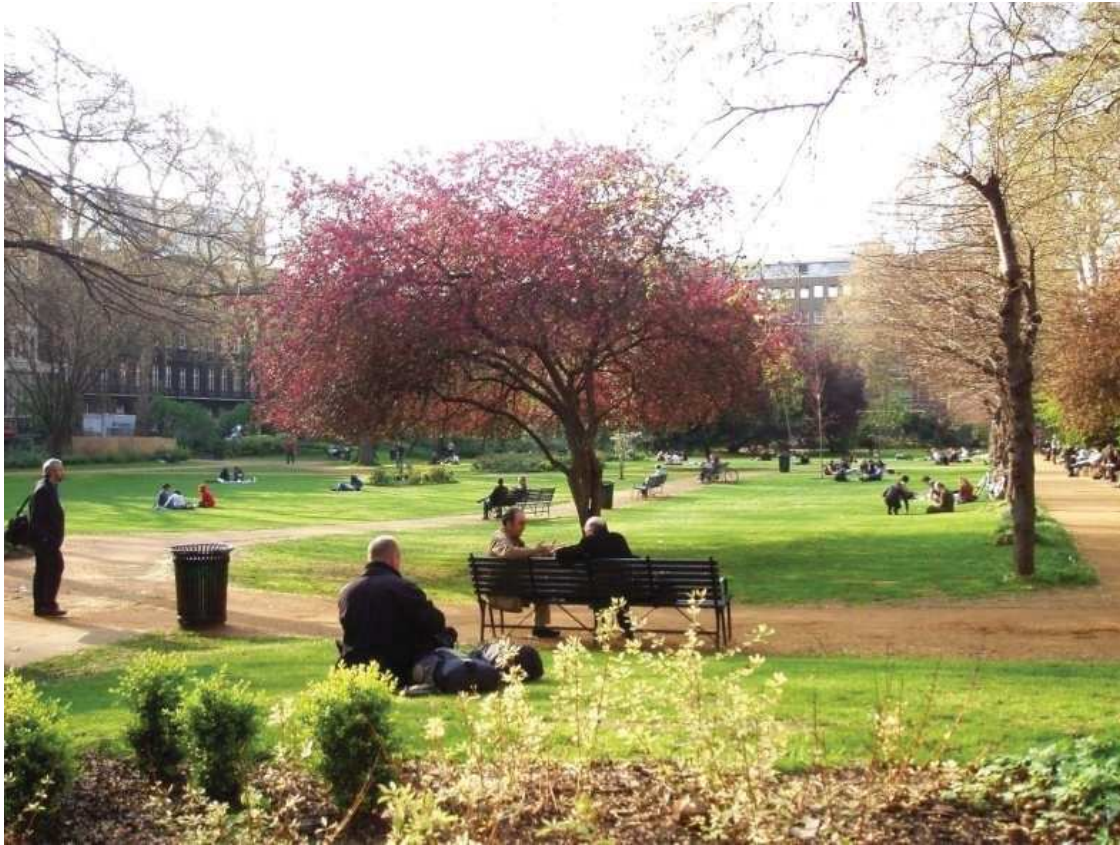
Рисунок 2 – Площадь Гордона в Лондоне

Примером озеленения и благоустройства России может быть сквер в Вологде. От площади Свободы начинается проспект Победы. Его украшают новые фундаментальные здания. Были посажены ель колючая, устроены цветники. Сквер занимает территорию площадью в 0,2 гектара и является одной из достопримечательностей города Вологда. В советский период выполнены серьезные работы по реконструкции и озеленению сквера. Активное участие в ней принимают жители города и в настоящее время.