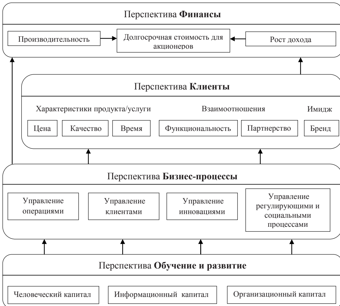
Рисунок 2 – Стратегическая карта причинно-следственных связей

Этап 2. Обоснование причинно-следственных связей между стратегическими целями графически отображается в стратегической карте (Рисунок 2).