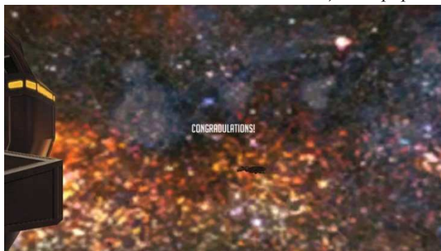
Рисунок 5 – Финальная кат-сцена

Планы по нововведениям. В ближайшем будущем в игру будет добавлен дополнительный уровень, на котором игроку предстоит управлять краном, смоделированным также в Houdini (рисунок 6).