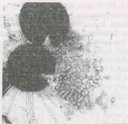
Рис. 4. Плодовое тело гриба со спорами

Как показали наши исследования, в плодовых телах уже осенью сформировались сумки в количестве от 4 до 8 шт. Они имели эллипсоидально-округлую форму и короткую ножку. Их размер изменялся в пределах 30–52 × 25–35 мкм. Стенки сумок толстые, с хорошо заметным двойным контуром. Вначале сумки были заполнены зернистым содержимым, затем в ноябре в них начался процесс образования аскоспор (рис. 4).