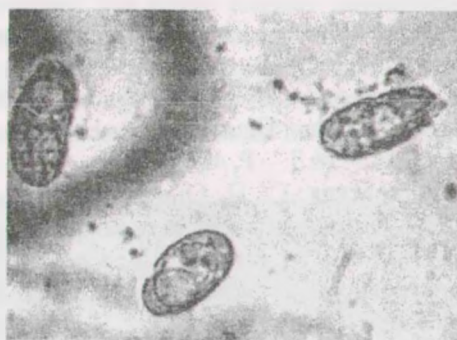
Рис. 5. Споры гриба Erysiphe flexuosa

Сумкоспоры прозрачные, имеют эллипсоидальную форму (рис. 5). Число спор в сумке по подсчетам колеблется от 6 до 8, преимущественно по 8 спор в сумке. Размеры сумкоспор по длине изменялись в пределах от 16 до 26 мкм, а по ширине от 7 до 12 мкм. Отношение длины спор к их ширине равняется 2.