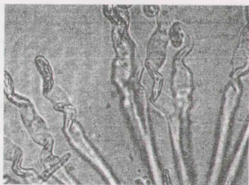
Рис. 3. Uncinula -подобные придатки гриба Erysiphe flexuosa

По подсчетам клейстотеции имеют от 9 до 40 Uncinula -подобных придатков. У основания они имеют толщину 3,8–6,4 мкм, в средней части перед закручиванием в спираль – 3,2–5,1 мкм. Uncinula -подобные придатки в 0,5–1,5 раза длиннее диаметра клейстотециев, их длина колеблется от 103 до 149 мкм, средняя длина придатков составляет 126,2 мкм.