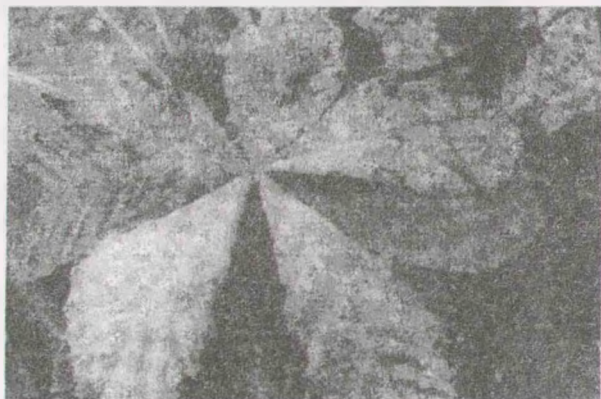
Рис. 1. Внешний вид мучнистой росы на листьях каштана конского обыкновенного

танию и уплотнению мицелия на верхней и нижней стороне листьев (рис. 1). Листья становятся серыми, матовыми, затем появляются коричневые пятна неправильной формы. Декоративные качества пораженных деревьев резко снижаются.