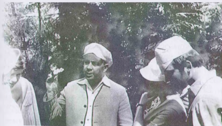
Со студентами на практике по лесозащите в Негорельском учебно-опытном лесхозе (1990 г.)