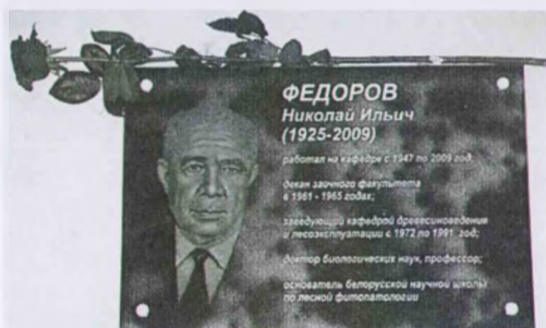
Мемориальная доска у кабинета профессора в БГТУ