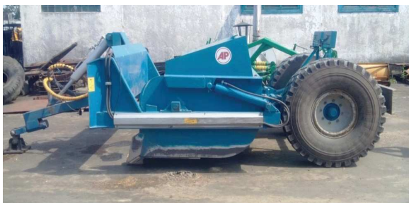
Рисунок 1 – Скрепер фирмы Mashinebouw

мещения призмы волочения и сопротивления, возникающего при заполнении ковша.