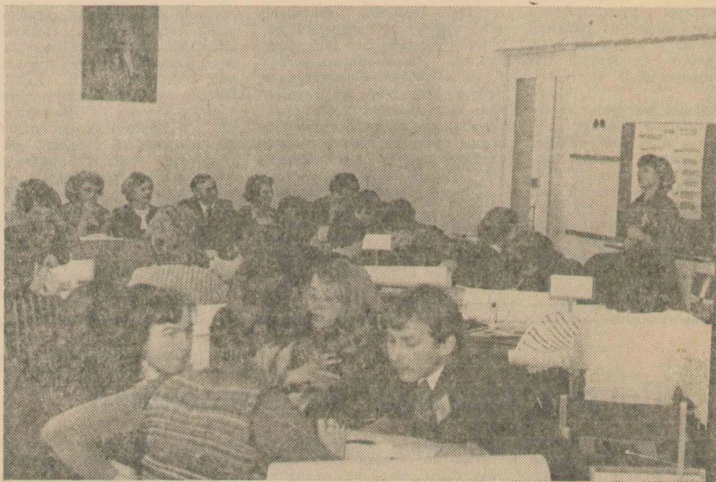
Увлекательной игрой, необходимой для серьезных дел, заняты студенты, которых наш вештатный фотокорреспондент Михаил Маруга запечатлел на этом снимке. Деловые игры — верный помощник для скорейшей адаптации выпускников вуза на производстве. Они помогают студентам приобрести навыки самостоятельного мышления,