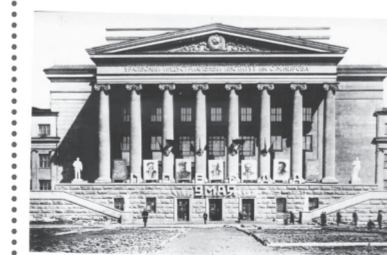
Главный учебный корпус Уральского лесотехнического института, 9 мая 1945 года

Во время Великой Отечественной войны институт эвакуирован в Свердловск и включен в состав Уральского лесотехнического института им. С.М. Кирова.