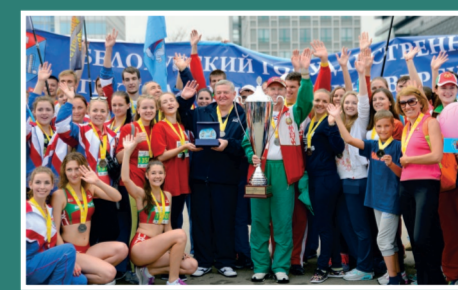
БГТУ – самый массовый участник на Минском полумарафоне-2016