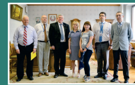
Университет встретил первого абитуриента, подавшего документы на поступление в БГТУ

Ректор Белорусского государственного технологического университета Игорь Витальевич Войтов