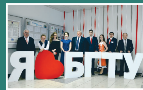
С участниками Республиканского бала выпускников