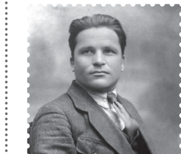
Сергей Миронович Киров — российский революционер, советский государственный и политический деятель

В 1934 году Лесной институт переименован в Белорусский лесотехнический институт, а в 1935 году ему присвоено имя С.М. Кирова.