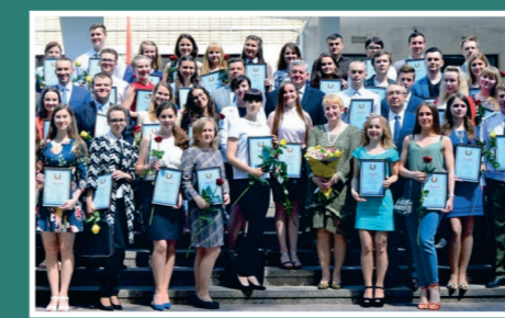
Поздравление лауреатов XIII Республиканского конкурса научных студенческих работ