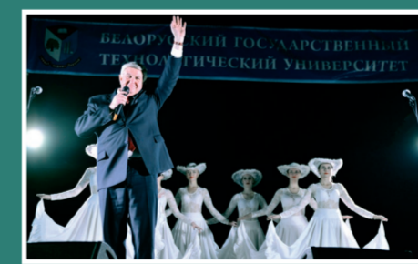
«Вечер первокурсника» на Минск-Арене