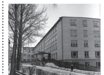
В 1970 году был построен 4-й корпус. Фото института середины 70-х гг.

Мы находимся в географическом центре нашей столицы. В шаговой доступности — все пять общежитий БГТУ, станции метро, Центральный автовокзал, Железнодорожный вокзал, площадь Независимости, торгово-развлекательные центры, художественный музей, популярная среди молодежи улица Октябрьская и др.