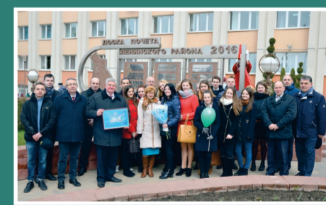
Занесение БГТУ на Доску почета Ленинского района