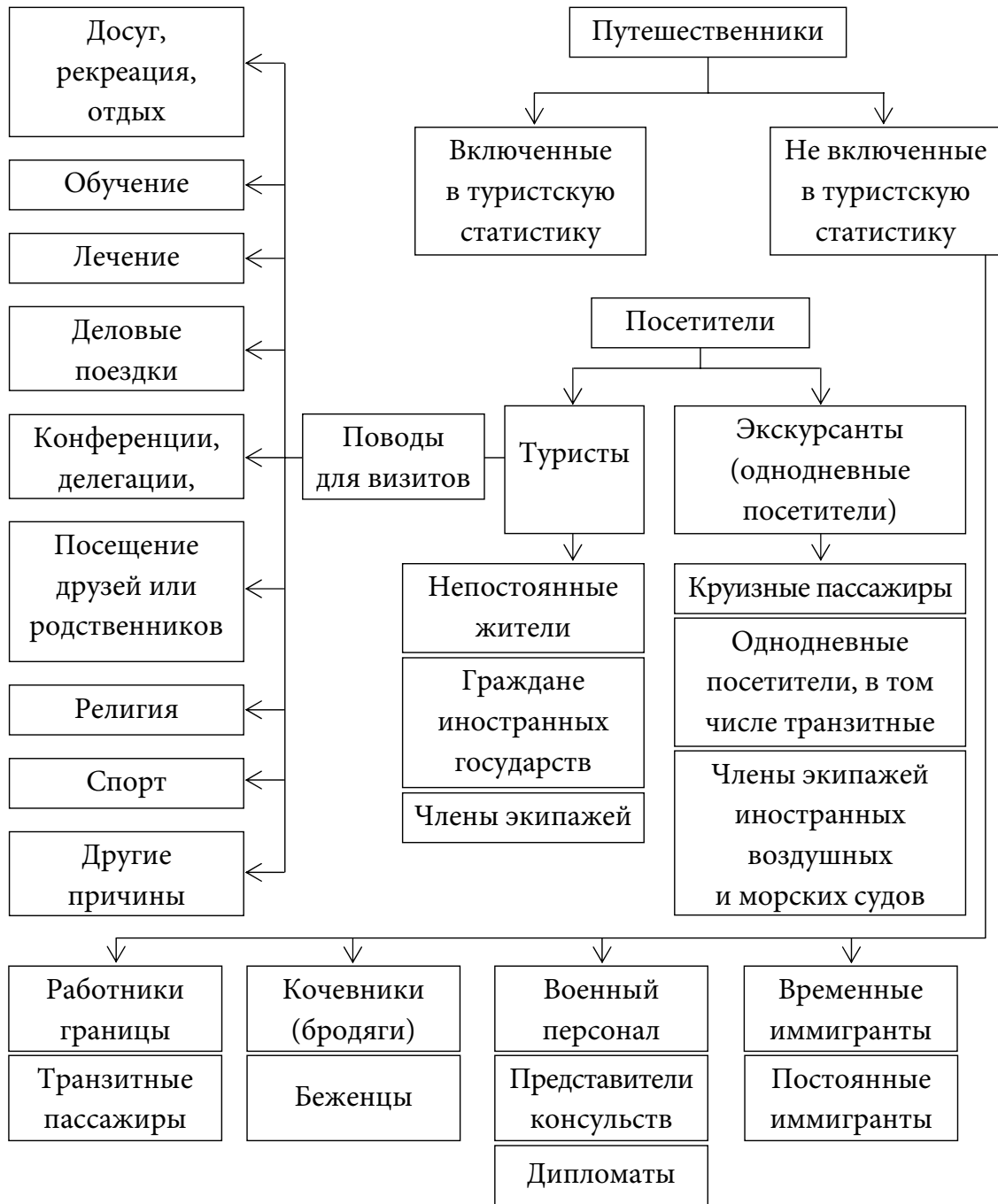
Рис. 1. Классификация путешествующих лиц