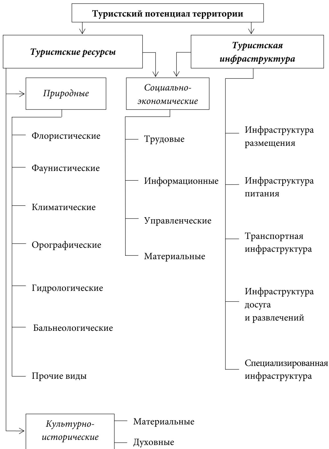
Рис. 3. Структура туристского потенциала территории