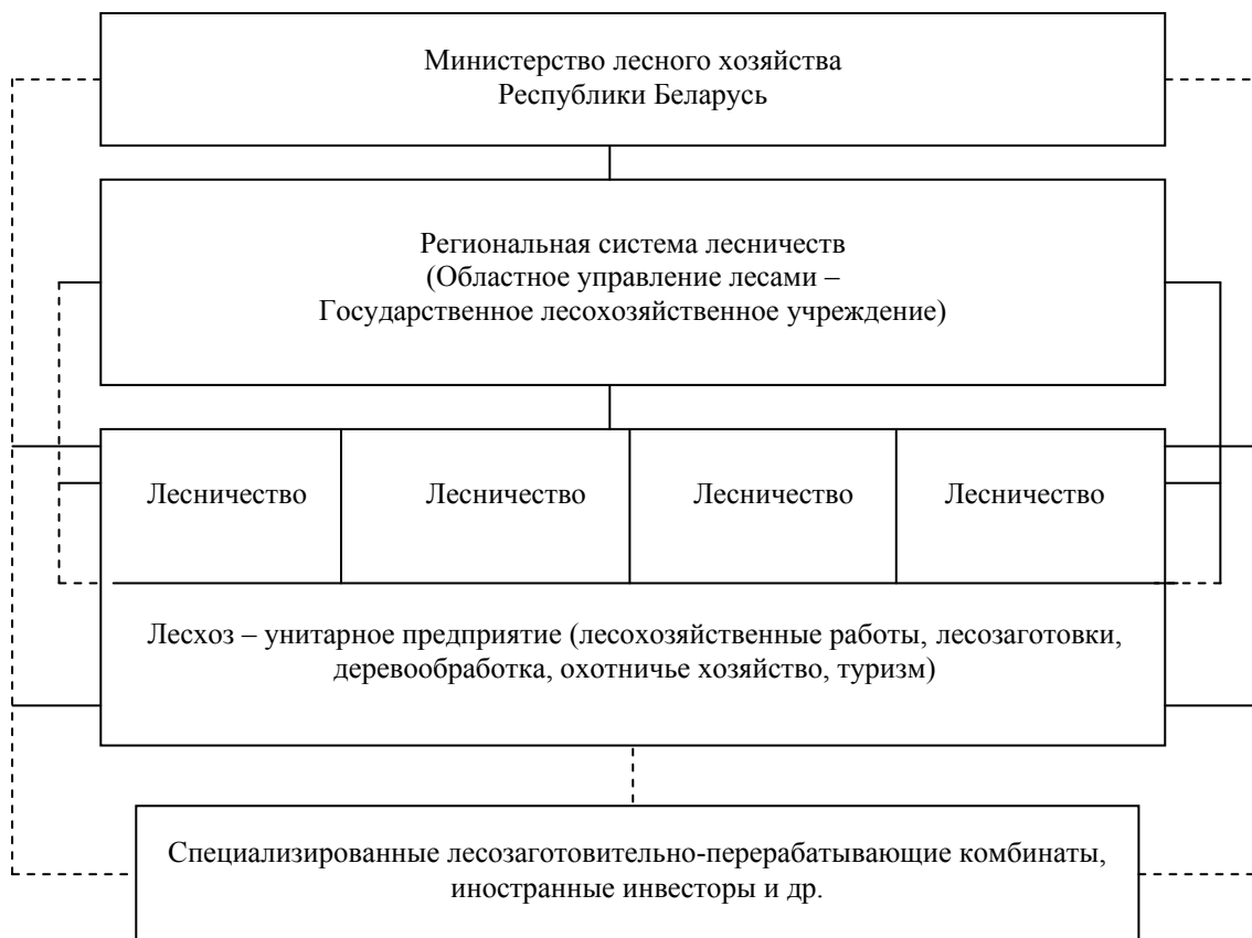
Рис. 1. Предлагаемая организационная структура управления лесным хозяйством (первый вариант)