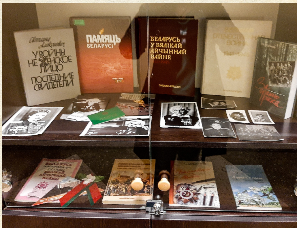
Выставка библиотеки «Была война...Была Победа...», фотографии ветеранов войны