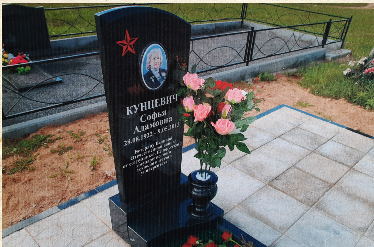
Памятник на кладбище Радошковичи