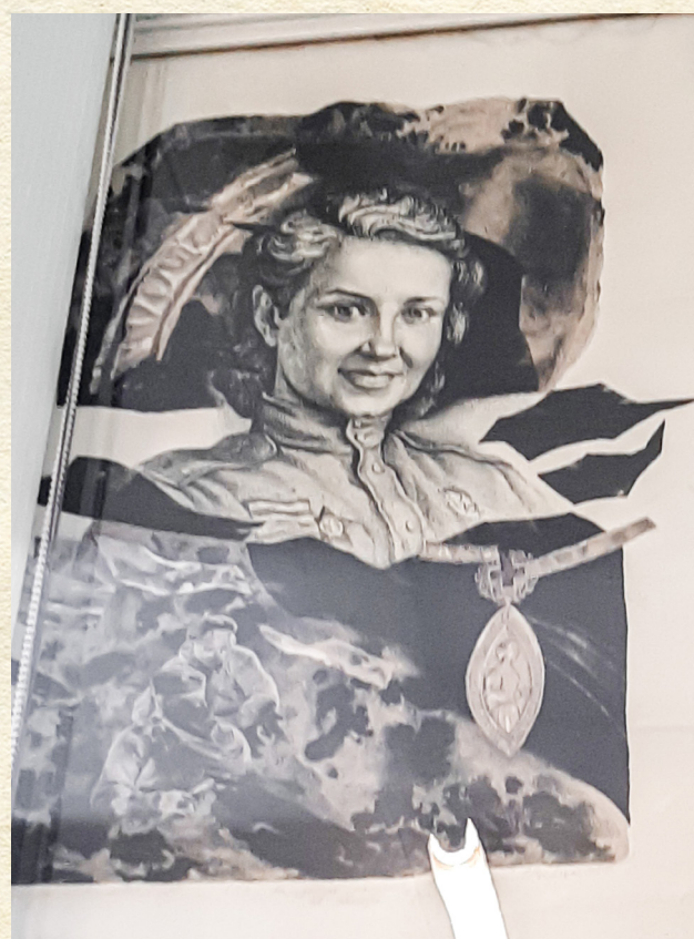
Портрет Софьи Кунцевич карандашом в библиотеке