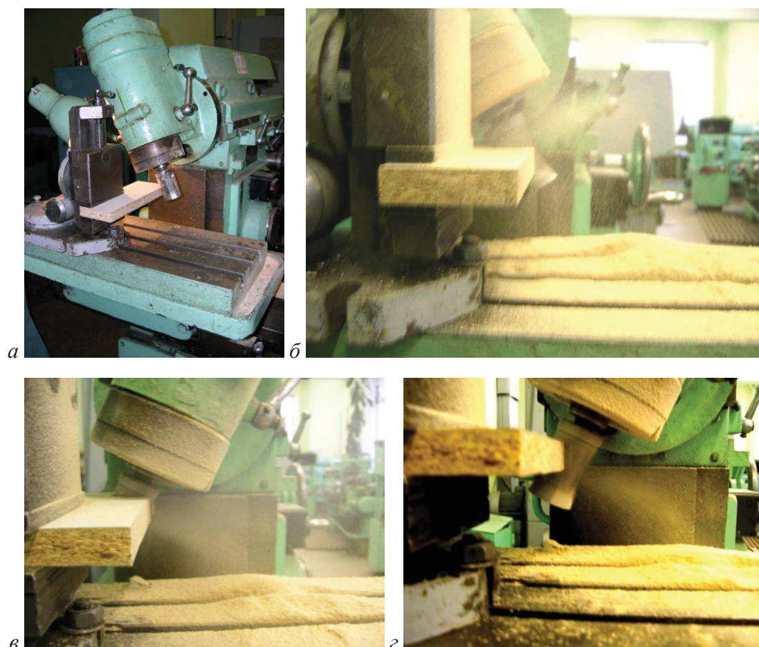
Рис. 3. Вертикально-фрезерный станок ( а ) и его применение для обработки заготовки ДСтП пустотелой фрезой, ось которой наклонена в направлении подачи (неполное фрезерование ( б )), фрезой, ось которой наклонена в направлении, противоположном направлению подачи (полное фрезерование ( в ), неполное фрезерование ( г ))

На рисунке 3 представлены фотографии вертикально-фрезерного станка ( а ) и его применения для обработки заготовки ДСтП пустотелой фрезой, ось которой наклонена в направлении подачи (неполное фрезерование ( б )), фрезой, ось которой наклонена в направлении, противоположном направлению подачи (полное фрезерование ( в ), неполное фрезерование ( г )).