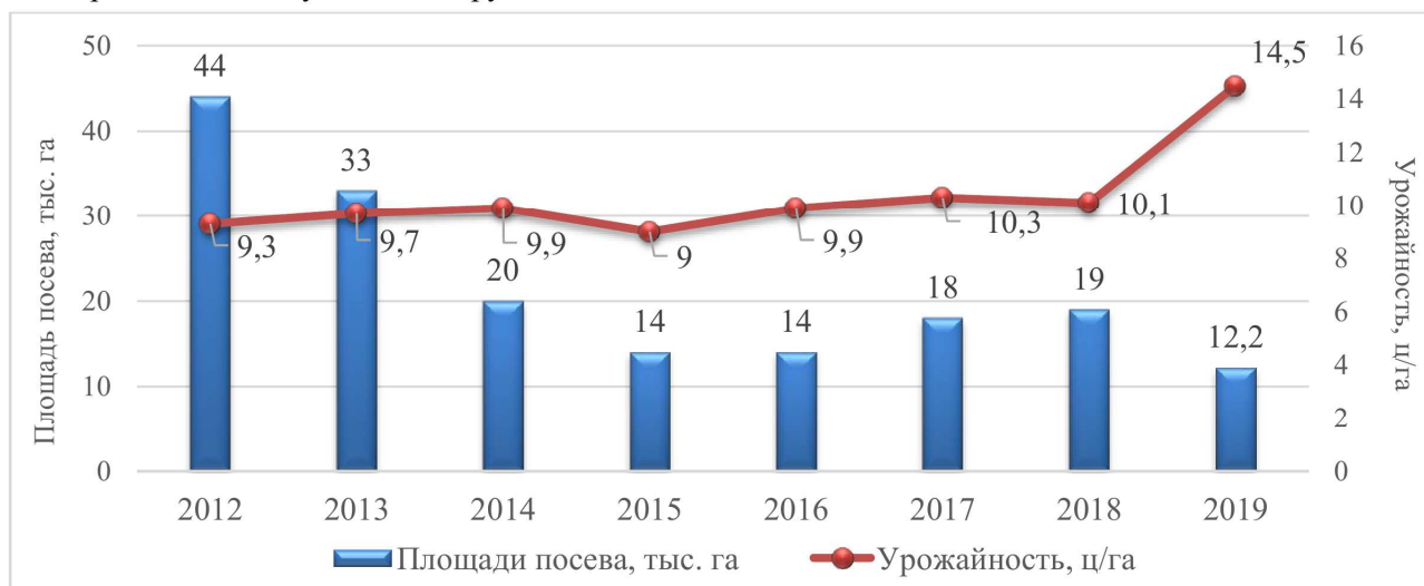
Рис 1. Динамика посевных площадей и урожайности плодов гречихи в Республике Беларусь

Объектом исследования выступал диплоидный сорт гречихи Лакнея с детерминантным морфотипом растения, внесенный в Госреестр РБ в 2012 г. Согласно данным ГСИ РБ средняя урожайность плодов за 2009–2011 гг. составила 21,0 ц/га, максимальная – 33,0 ц/га. Средняя масса 1000 семян 29,9 г. Выравненность плодов 85 %, пленчатость 22,3 %. Выход крупы 72 %, крупяного ядра 55 %, содержание белка в крупе 14,8 %. Вкус каши 5 баллов. Включен в список наиболее ценных по качеству сортов [9]. К моменту проведения исследований сорт высевался на площади 225 га. К 2019 году его посеы увеличились до 1243 га или в 5,5 раза и достигли доли 7,5 % от всех площадей, занимаемых гречихой в Республике Беларусь.