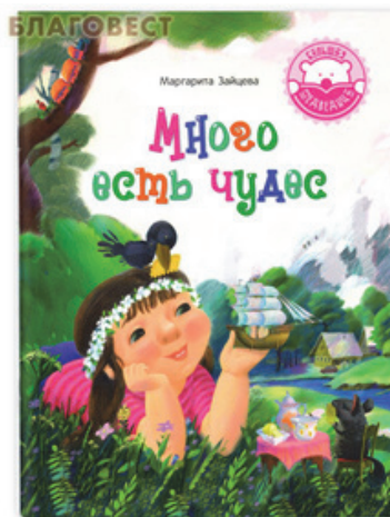
Рис. 11. Обложка книги «Много есть чудес» серии «Большая медведица»

сострадание. Православное книгоиздание содействует нравственному просвещению и воспитанию общества, способствует его духовному возрождению, и прежде всего подрастающего поколения [4, 5].