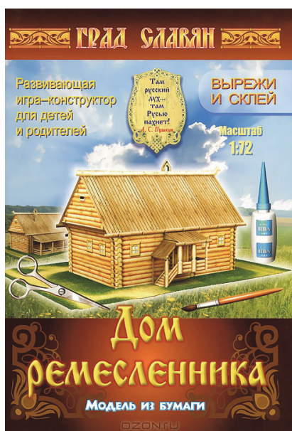
Рис. 2. Обложка книги «Дом ремесленника» серии «Град славян. Модель из бумаги»

Серию выделяет качественное художественно-полиграфическое исполнение. Модели напечатаны на тонком картоне, поэтому удобно клеить и дольше сохраняется вид изделия. Книжки содержат схему и описание сборки.