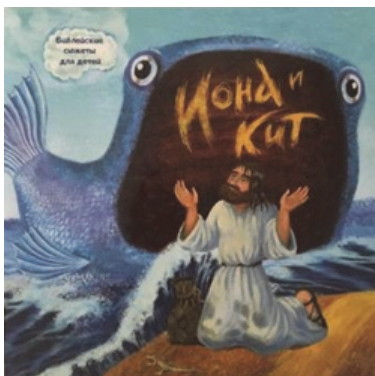
Рис. 3. Обложка книги «Иона и кит» серии «Библейские сюжеты для детей»

красочными иллюстрациями. Понятный текст ребенок легко воспринимает и охотно слушает рассказ.