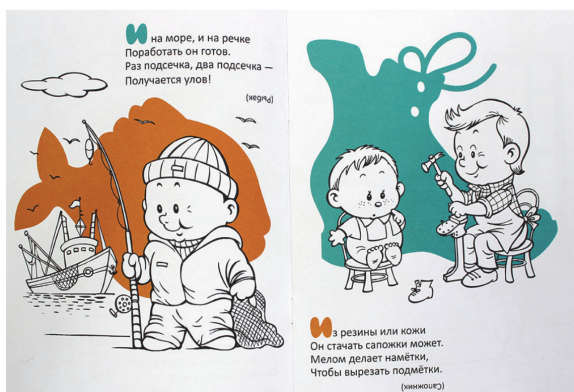
Рис. 7. Разворот книги «Кем быть» серии «Все профессии важны»

Превратить изучение профессий в веселую игру помогут увлекательные загадки и интересные наклейки, представленные в издании.