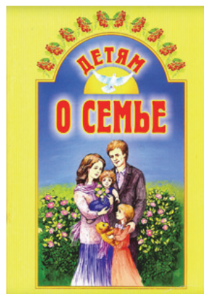
Рис. 1. Обложка книги «Детям о семье» серии «Детям о...»

Выпуск изданий на тему семьи способствует возвращению общества к своим лучшим истокам, семейным ценностям. В семье будущее поколение воспитывается, учится любви и вере, терпению и заботе, прощению и самопожертвованию. И все, что в детей заложат в семье, они реализуют во взрослой жизни. Именно об этом книга «Детям о семье» (рис. 1).