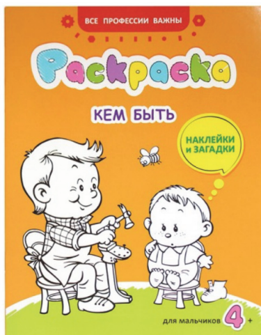
Рис. 6. Обложка книги «Кем быть» серии «Все профессии важны»

Превратить изучение профессий в веселую игру помогут увлекательные загадки и интересные наклейки, представленные в издании.