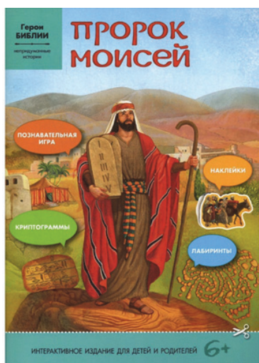
Рис. 4. Обложка книги «Пророк Моисей» серии «Герои Библии: непридуманные истории»

На страницах красочно иллюстрированного издания «Пророк Моисей» (рис. 4) детей ждет не только пересказ жития пророка Моисея, но и увлекательные творческие задания.