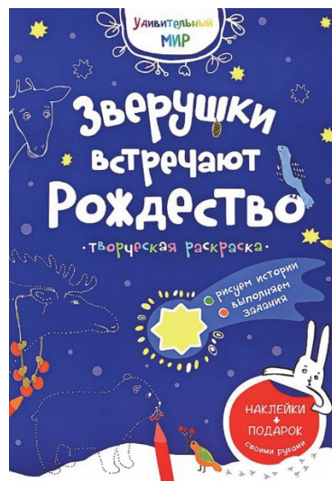
Рис. 8. Обложка книги «Зверушки встречают Рождество» серии «Удивительный мир»

Узнают, какие птички могут напугать даже слона, чем любит лакомиться попугай ара и какая птичка самая маленькая на Земле.