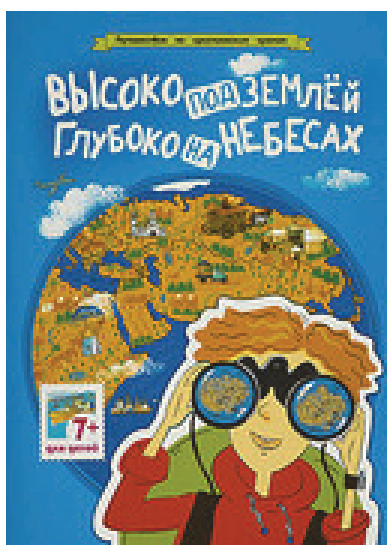
Рис. 10. Обложка книги «Высоко под землей, глубоко на небесах» серии «Путешествие по христианским храмам»

Следует отметить серию «Путешествие по христианским храмам». Книга «Высоко под землей, глубоко на небесах» (рис. 10) рассказывает в интересной форме о видах православных храмов и об их устройстве. Текст дополнен творческими заданиями, оригинальными иллюстрациями, картами.