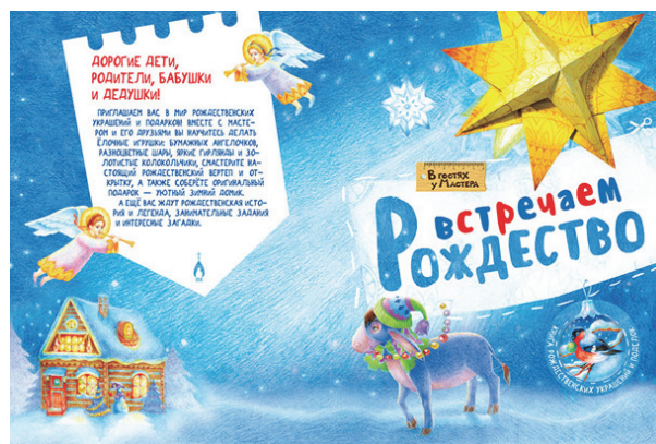
Рис. 5. Обложка книги «Встречаем Рождество» серии «В гостях у Мастера»

В книге «Встречаем Рождество» (серия «В гостях у Мастера», Издательство Свято-Елисаветинского монастыря) читатели знакомятся с Мастером и его друзьями, узнают о празднике Рождества Христова, а также смогут сделать вместе с ним множество рождественских поделок (рис. 5). Подарком станет макет рождественского вертепа. Эту поделку можно легко сделать вместе с малышом, и она станет необычным украшением каждого дома в рождественские дни.