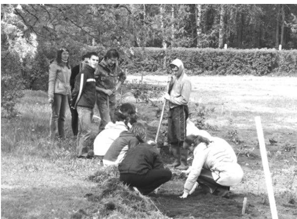
Рис. 3. Работы по созданию теневого сада на территории партерной части ботанического сада НУОЛХ в период учебной практики (студенты 4 курса специальности «Садово-парковое строительство», 2008 г.)

Учебными практиками «Цветоводство» и «Ландшафтная архитектура» предусмотрены анализ ассортимента древесных и цветочных декоративных растений, оценка эстетического состояния, пространственного построения и колористического решения композиций на объектах ландшафтного строительства г. Минска, сравнение их с историческими аналогами мировой практики и разработка научно обоснованных предложений по совершенствованию [2].