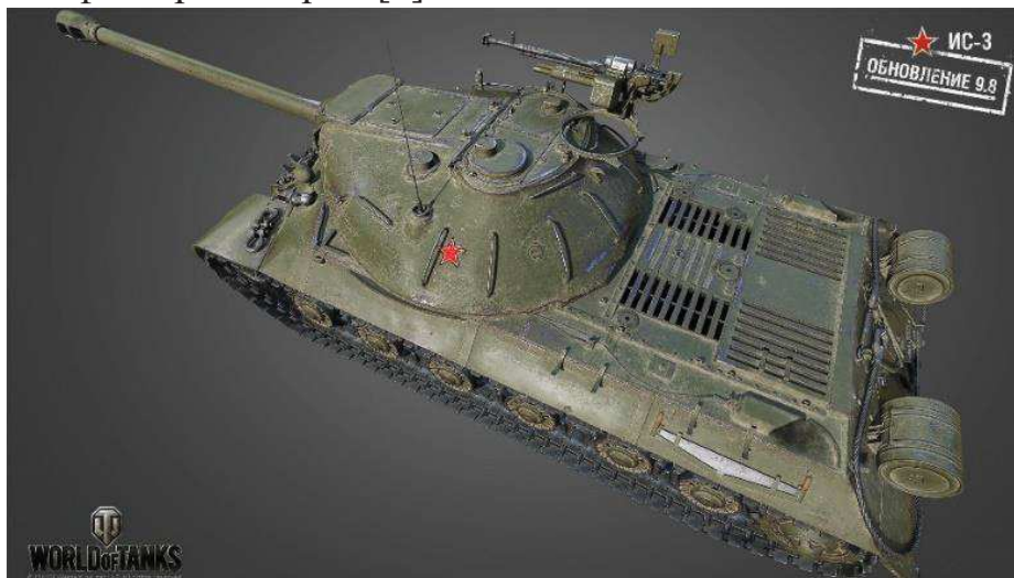
Рисунок 1 – Модель ИС-3, созданная с помощью фотограмметрии

Модель ИС-3 в компьютерной игре Word Of Tanks создана с помощью фотограмметрии [2].