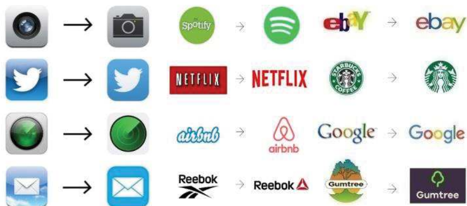
Рисунок 2– Иконки и логотипы до и после редизайна

Как отмечает компания, контент и то, как он оформлен, должен быть доступным для пользователей и при этом легко считываемым.