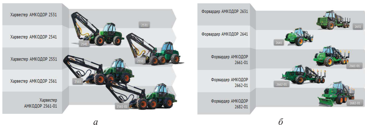
а – харвестеры Амкодор; б – форвардеры Амкодор

Материалы и методы. Модельный ряд лесопромышленных машин Амкодор представлен техникой, предназначенной для работы в условиях лесосек, погрузочных пунктов и лесных складов. Для проведения лесосечных и лесотранспортных работ выпускаются машины, реализующие технологию заготовки древесины в виде сортиментов, сортиментов и щепы. Машины для сортиментной заготовки представлены харвестерами (2531, 2541, 2551, 2561 и 2561-01) и форвардерами (2631, 2641, 2661-01, 2662-01, 2682-01) (рисунок 1). Они образуют соответствующие системы машин (комплексы) для проведения работ на рубках главного и промежуточного пользования, в том числе на прочистках и прореживаниях молодняков и средневозрастных древостоев. Машины значительно отличаются между собой конструктивно, имеют существенные различия в массово-габаритных и энергетических характеристиках, оснащены разным технологическим оборудованием (таблицы 1 и 2).