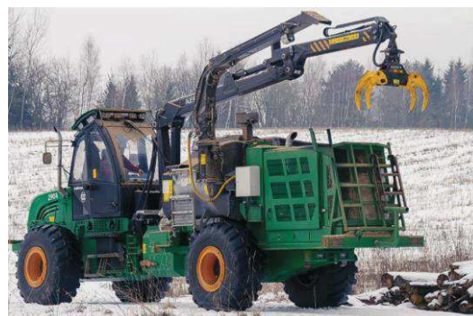
Рисунок 3 – Технические характеристики и общий вид машины рубильной «Амкодор 2904»

Обеспечив машинами лесопромышленное производство холдинг поэтапно переходит к освоению машин, предназначенных для ведения работ лесохозяйственного профиля: уборки лесосек, подготовки площадей к посадке леса и проведения лесовосстановительных работ. налажен выпуск специального лесохозяйственного оборудования и быстросъемных органов (рисунок 4), агрегируемых с трелевочными тракторами Амкодор 2243 и 2243В.