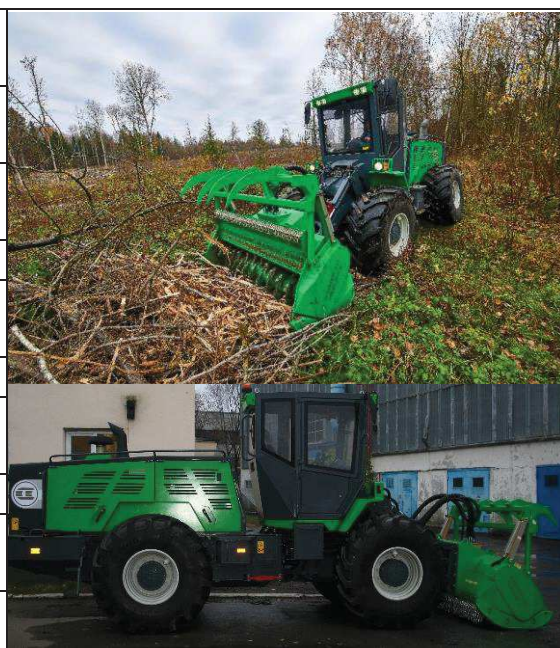
Рисунок 5 – Технические характеристики и общий вид мульчирователя «Амкодор 2021»

Результаты. Сравнительный анализ технических характеристик и тенденций развития модельного ряда машин был реализован на примере машин для заготовки сортиментов «Амкодор» и других ведущих мировых производителей: Ponsse, Komatsu, John Deere (рисунок 6). В результате исследований были установлены корреляционные зависимости [1], отражающие общие тенденции и технический уровень машин различных производителей.